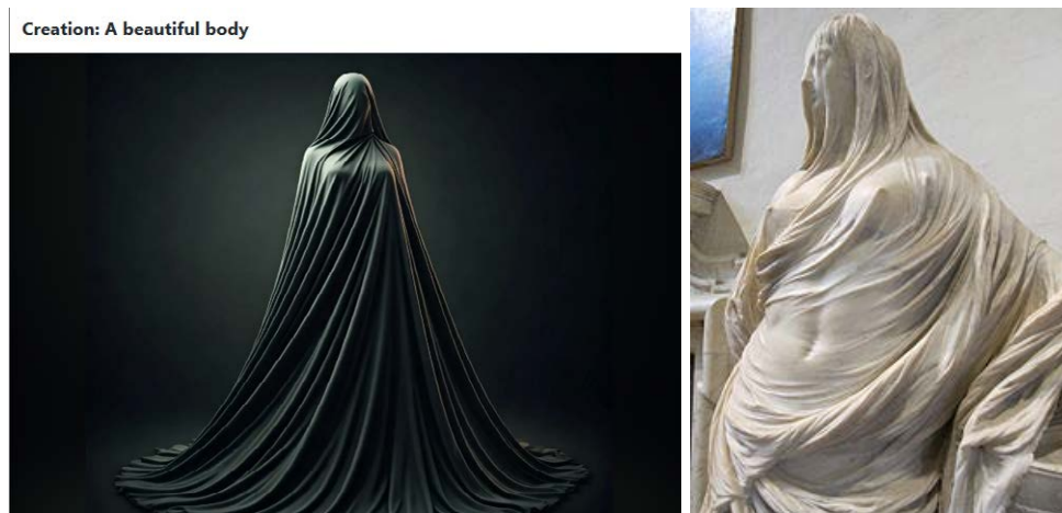
Figura 5 – Imagem gerada a partir do termo A beautiful body e estátua de Corradini

Tal imagem recorda as obras Pietà , de Michelangelo e as esculturas do italiano Antonio Corradini, esculpidas utilizando a chamada técnica do véu ou tecidos de mármore . Esse tipo de técnica usa o véu como recurso estilístico ao esconder e revelar, sugerindo o mistério e a sensualidade ao cobrir o corpo da mulher. Veja-se: