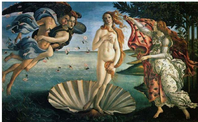
Figura 2 – Obra “O Nascimento de Vênus”

Fonte: Tela de Sandro Botticelli “O Nascimento de Venus (1485)