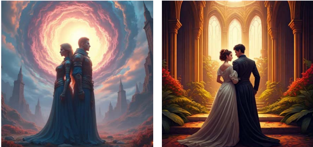
Figuras 12 e 13 – Imagens geradas a partir do termo a powerful couple