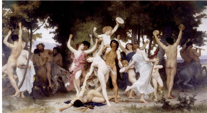
Figura 3 – Obra A Juventude de Bacchus