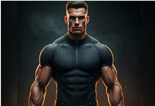
Creation: An art with a handsome body