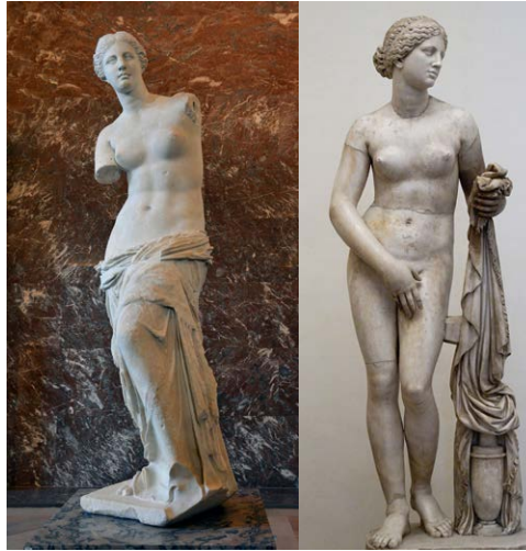
Figura 1 – As obras Vênus de Milo e Afrodite de Cnido

descrição similar, alegando que “ela é conhecida por retratar a deusa nua, algo inovador para a época. A escultura foi celebrada por sua forma graciosa e pela harmonia do corpo feminino idealizado” (ChatGPT, 2024).