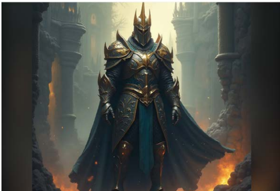
Creation: a powerful man