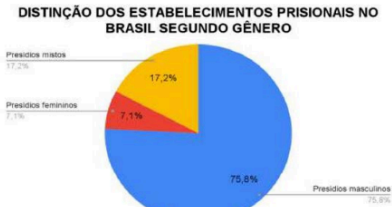
Gráfico 1: Divisão por gênero dos Estabelecimento Prisionais no Brasil

O aumento massivo da custódia de mulheres é muito preocupante e tem sido uma das preocupações do Plano Nacional de Política Criminal e Penitenciária.