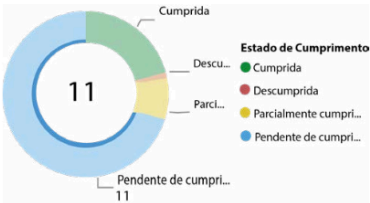
173 Imagem 2 - Medidas de Reparação por estado de cumprimento

Quanto ao caso Empregados da Fábrica de Fogos de Santo Antônio de Jesus e seus Familiares Vs. Brasil , aparece graficamente os seguintes resultados quanto ao cumprimento de sentença, segundo o CNJ: