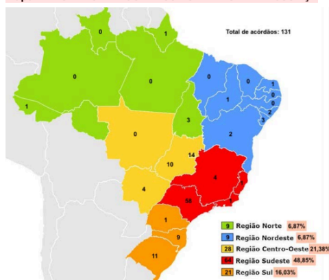
Mapa 1 - NÚMERO DE ACÓRDÃOS POR TRIBUNAL DE JUSTIÇA