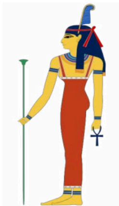
1 Figura 2 - Deusa egípcia Mâat