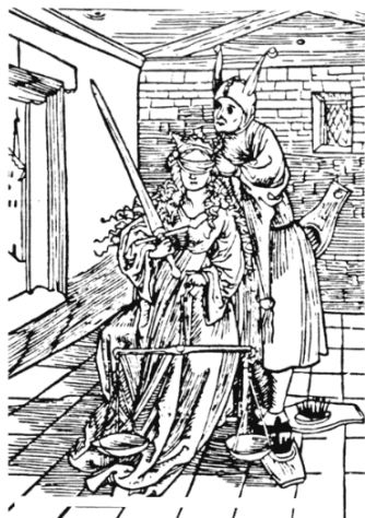
Figura 4 – Ilustração Le foubande les yeux de la Justice .