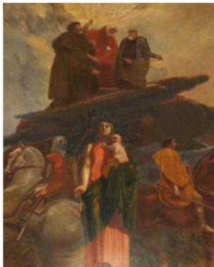
Figura 1 – Ilustração La paix et la justice

Por fim, apresenta-se a oliveira, a "árvore da justiça". Na verdade, a árvore aparece associada à paz, com base na tradição judaico-cristã, bíblicamente narrada de que a folha carregada pela pomba, vinda da terra firme a Noé em sua arca após o dilúvio, pertencia ao galho de uma oliveira, marcando, dessa forma, o fim da ira com a qual Deus havia punido seu povo; e, no cenário grego e romano, a oliveira aparece consagrada a Atena e Minerva, deusas da sabedoria, respectivamente (CHEVALIER; GHEERBRANT, 1990, p. 656-657).