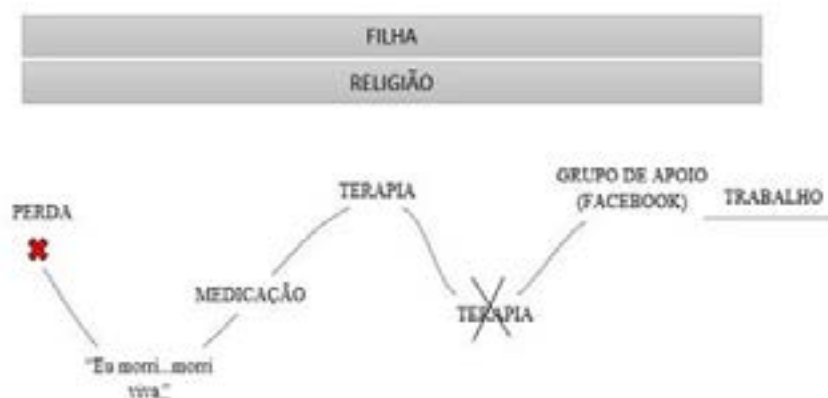
Recursos utilizados por Rita no movimento transitivo iniciado com a perda