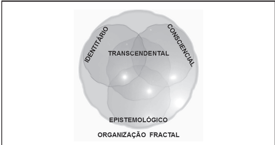
Figura 1 – Morfologia da célula-mãe de uma Organização – Aspecto “Espírito”.