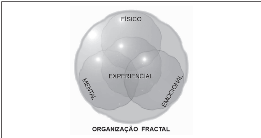
Figura 2 – Morfologia da célula-mãe de uma Organização – Aspecto “Corpo”.