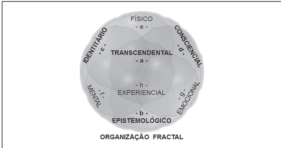
Figura 3 – Morfologia da célula-mãe de uma Organização Fractal.

A célula-mãe de uma Organização, que funciona como um ser vivo inteligente, cujos componentes principais são os seres humanos que a constituem, teria a seguinte morfologia mostrada na Figura 3, representando os elementos descritos como se segue: